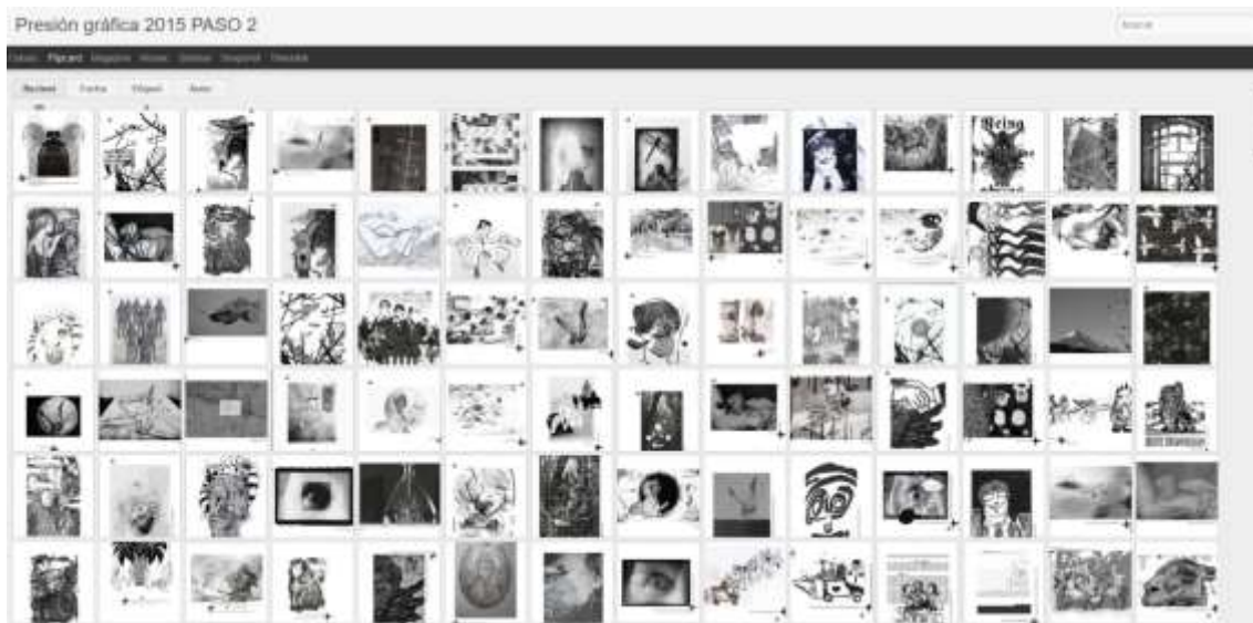
Figura 3. Captura de pantalla del archivo virtual online de las reversiones del Remixado Gráfico (2015). En: http://presiongrafica2015paso2.blogspot.com.ar/ (Fecha de consulta: 20/04/2018)

Las nuevas imágenes llevan los nombres tanto del autor o autores de las imágenes iniciales como del que realizó la nueva versión. En este proceso desaparece así el lugar de receptor pasivo y, como señala Blas Benito, “[...] la creación de la obra deviene en una permanente inconclusión. [...] el artista único deja paso a un nuevo modelo de creador colectivo [...] capaz de alterar sin limitaciones un resultado hipotético” 25 . En cuanto a los derechos de imagen los organizadores aclaraban en la convocatoria que el juego funcionaba con criterios de licencia Creative Commons 26 y que “el proyecto se enmarcaba en conceptos como obras culturales libres y copyleft ” (Figura 4). Para ello se solicitaba que al momento de enviar las imágenes el autor explicita su conformidad con el libre uso de las mismas. Además del remixado vía internet, realizaron un remixado presencial durante el desarrollo del festival, para lo cual las personas eran convocadas a descargar e imprimir las imágenes que quisieran para realizar el reversionado en vivo mediante procedimientos manuales como cortar, pegar, rallar, escrachar, saltar, pintar, repetir, anular, etc. 27