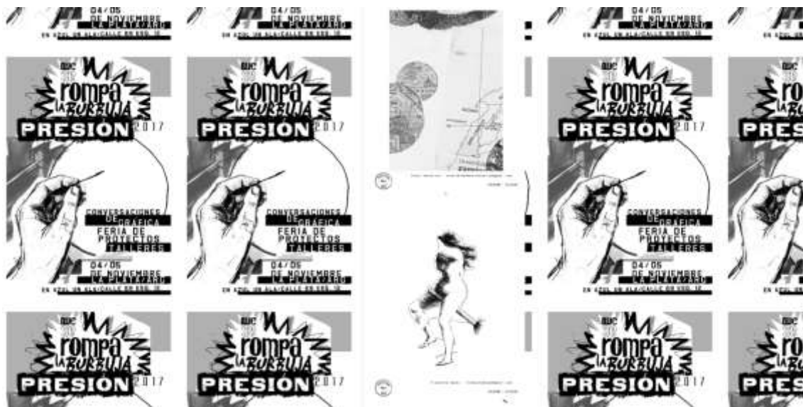
Figura 6. Captura de pantalla del archivo virtual de fragmentos de la Canasta Gráfica (2017). En: http://presiongrafica2017.blogspot.com.ar/p/imagenes-enviadas-presion-la-canasta.html (Fecha de consulta: 20/04/2018)

imágenes, pensando prácticas diferentes, nuevas formas de hacer imágenes, nuevos juegos... 34 .