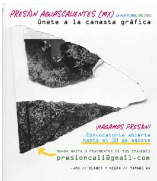
Figura 5. Flyer de la convocatoria a la Canasta Gráfica , Presión Aguascalientes, México; La Plata, Argentina y Cali, Colombia (2017). En: https://www.facebook.com/casalosfuegos/photos/a.176827562725150.1073741828.176166832791223/295115537563018/?type=3&theater (Fecha de consulta: 20/04/2018)

Una particularidad de esta edición fue que se convocó tanto desde Presión La Plata , como en las ediciones anteriores las anteriores, como desde Presión Cali (Colombia) y Presión Aguascalientes (México) (Figura 5). Los organizadores señalan: “[...] queremos llenar la canasta gráfica de materia prima para futuras re-mezclas. Necesitamos un trozo de tus imágenes, un retazo en formato .JPG blanco y negro [...] En Presión La Plata (Argentina), Cali (Colombia) y Aguascalientes (México) usaremos los retazos de imágenes para experiencias de producción de imágenes colectivas” 32 .