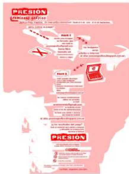
Figura 4. Flyer con las instrucciones para participar del Remixado Gráfico, juego gráfico internacional (2015). En http://4.bp.blogspot.com/-HSMCRAPMbvA/Vaw180rSZBI/AAAAAAAAABO0/hbQz7m1w54U/s1600/basesweb.jpg (Fecha de consulta: 20/04/2018)

La edición 2017, menciona Florencia Basso integrante del grupo gestor, tuvo “dos componentes: por un lado, ‘Que se rompa la burbuja’ que es como la frase inspiradora, la idea a la que apuntamos; y por otro, ‘Gráfica a la canasta’ que vendría a ser el procedimiento, cómo elaboramos las imágenes” 28 . A su vez señala