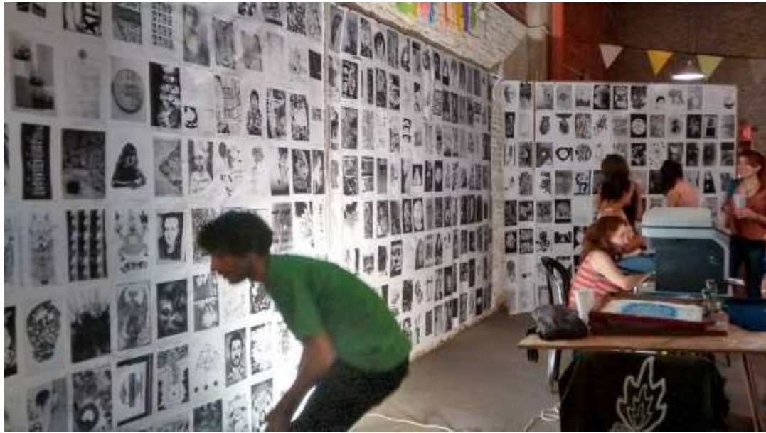
Figura 2. “Tenedor libre de imágenes” en Presión Festival de Gráfica Contemporánea Edición 2014.