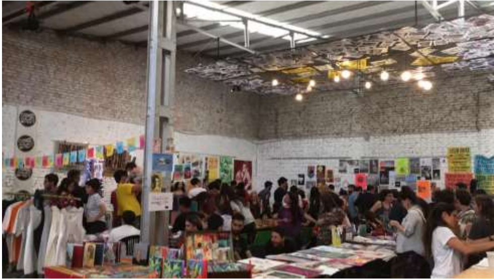
Figura 1. Vista general del festival Presión (2016).